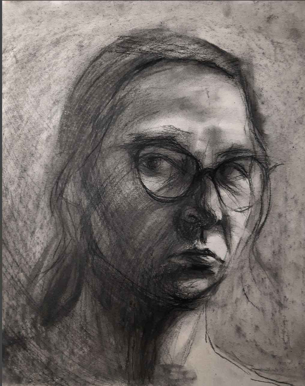
Autoportret, węgiel na tekturze, 40 x 30 cm