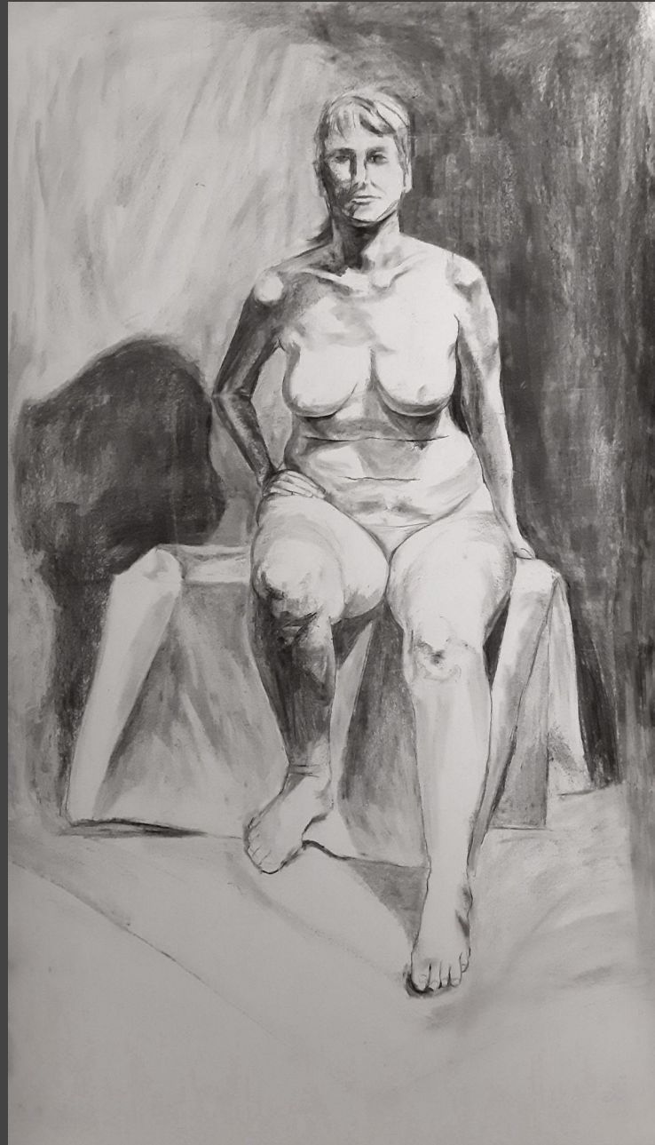
bez tytułu , węgiew na papierze, 140 x 80 cm