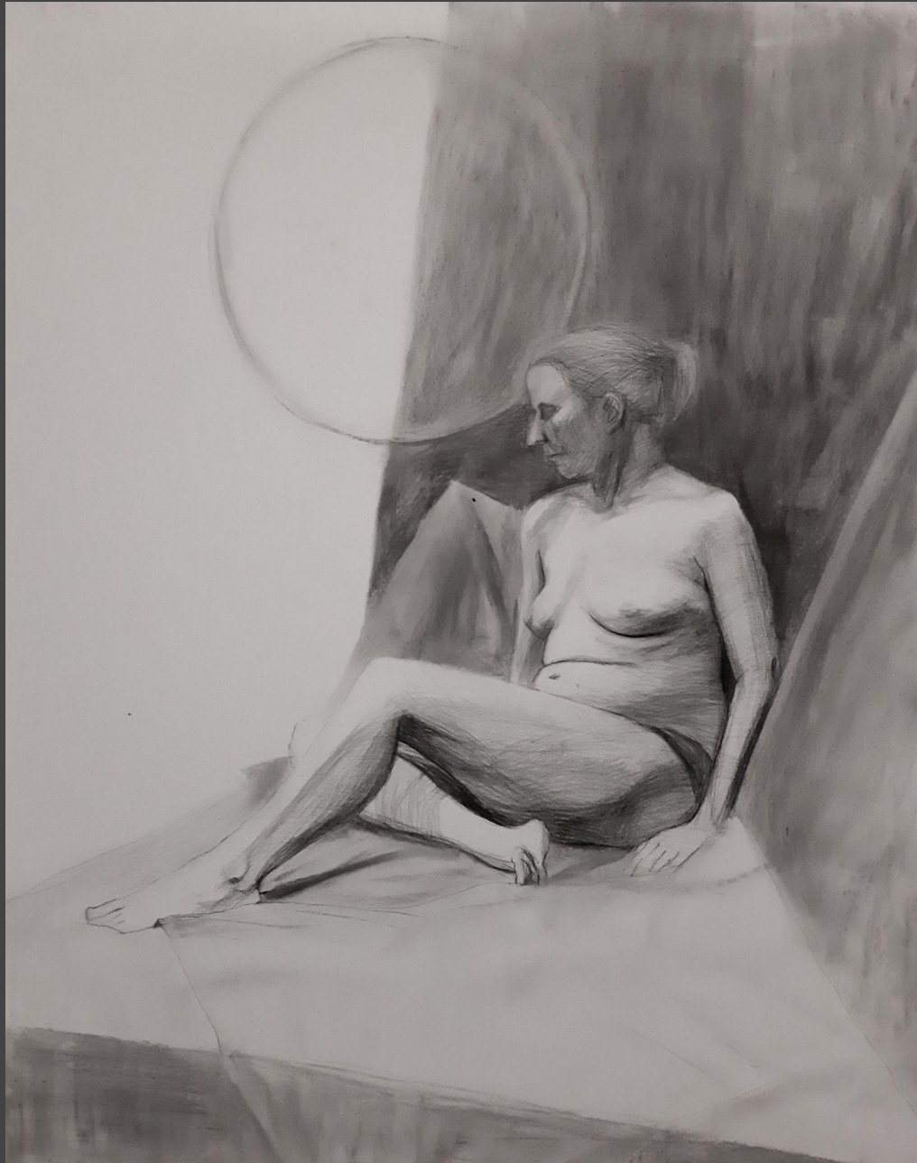
bez tytułu , węgiel na papierze, 170 x 140 cm