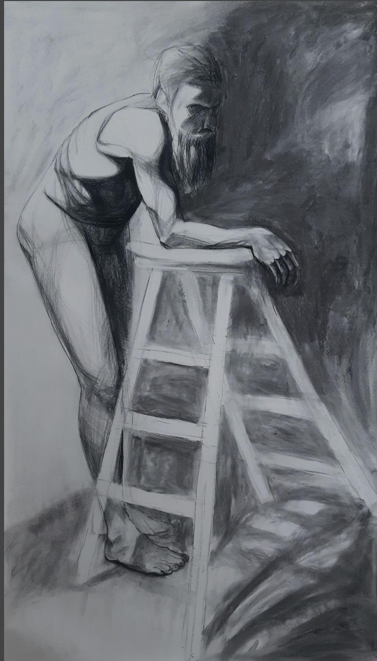
bez tytułu , węgiel na papierze, 140 x 80 cm