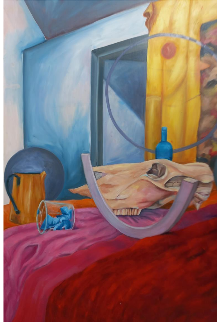
Martwa natura, olej