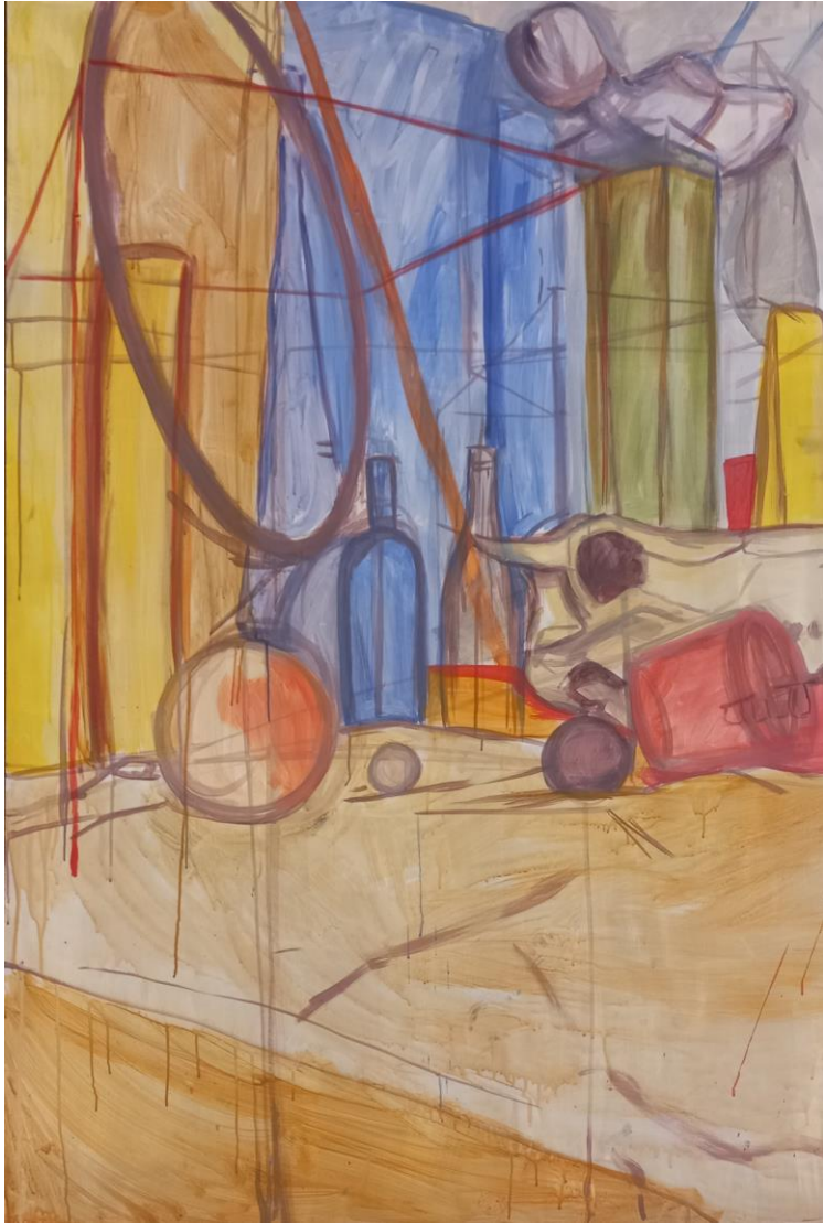
Martwa natura, olej