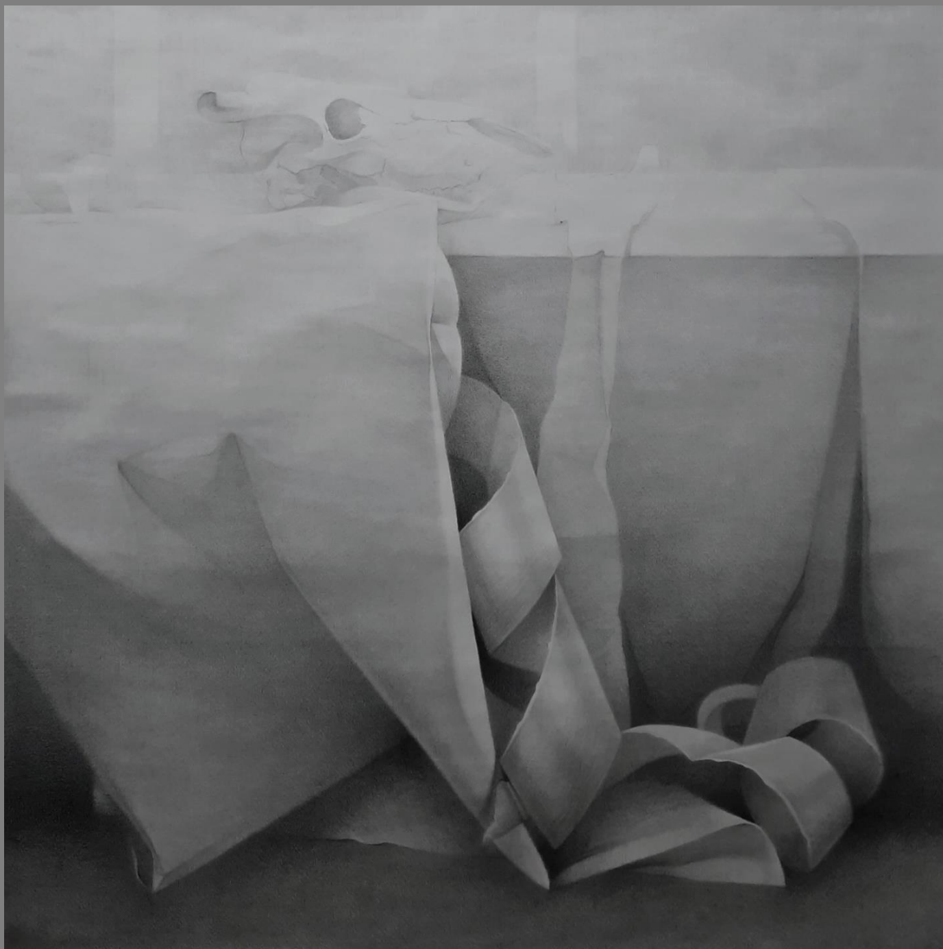
Studium martwej natury Kredka, 150x150cm