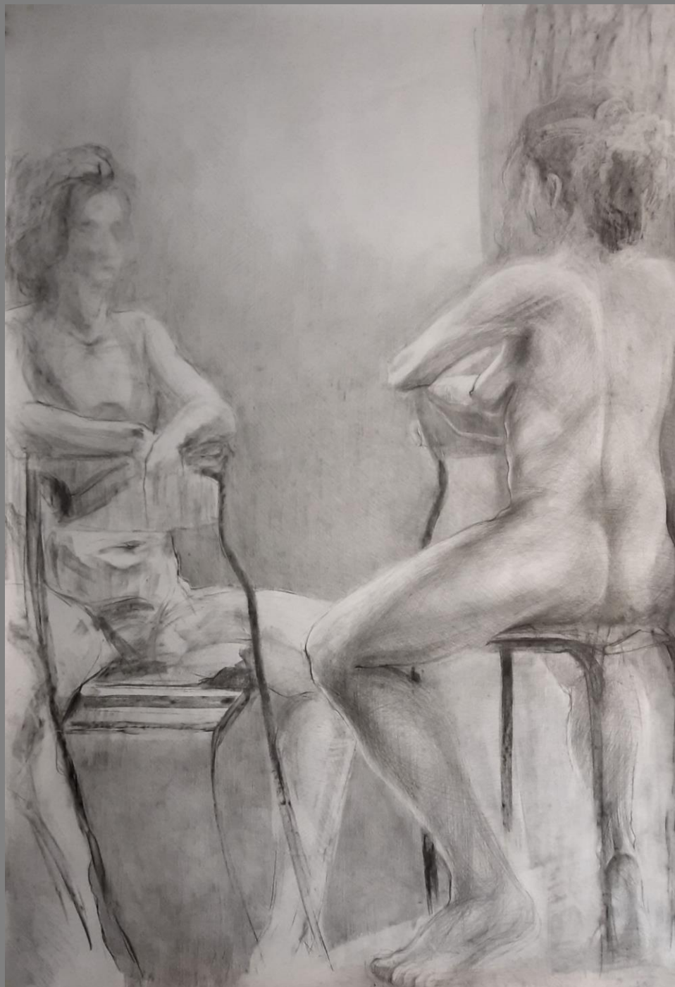
Szkic modelki Ołówek i węgiel, 150x100cm