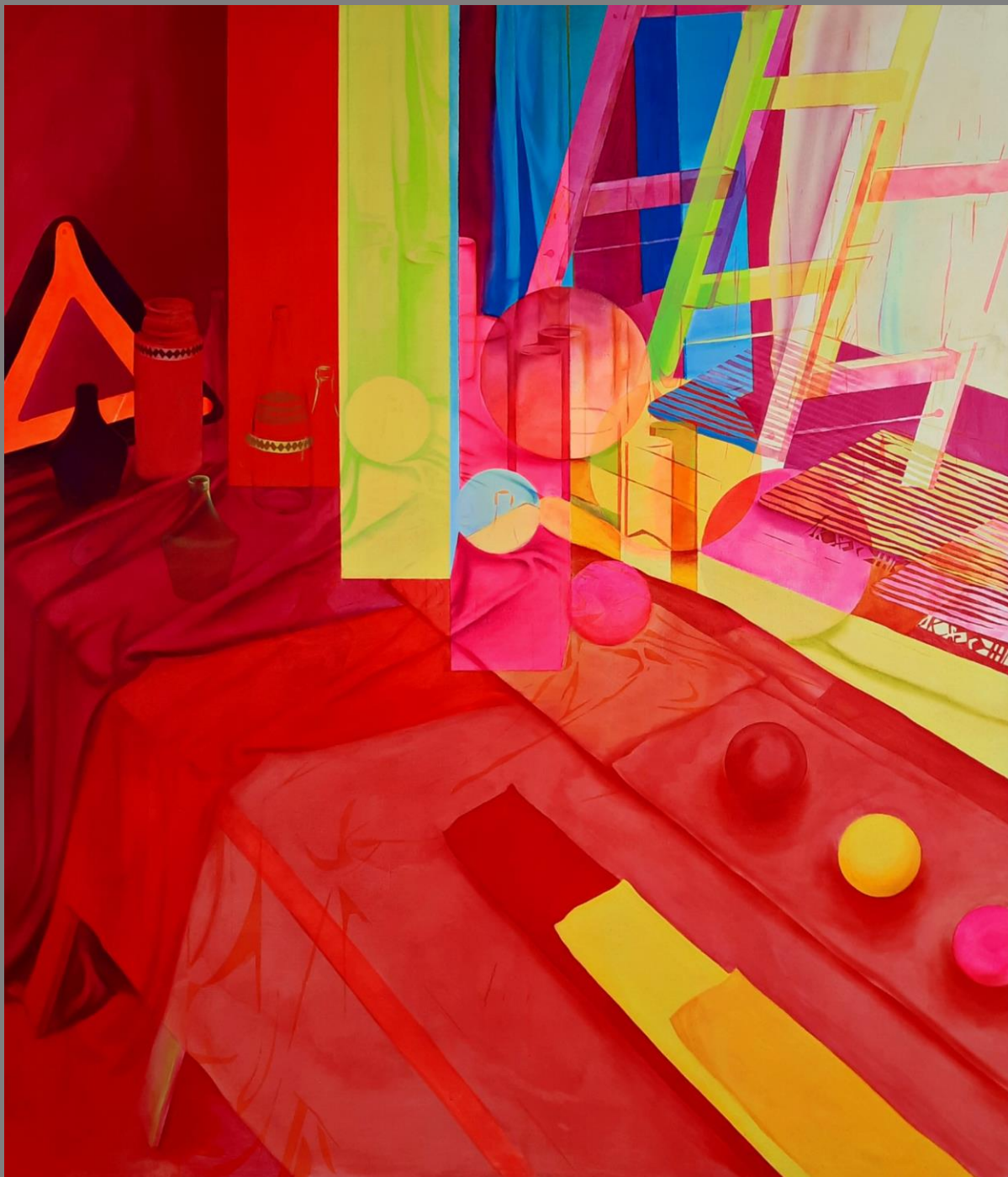
Interpretacja martwej natury Olej na płótnie, 140x120cm