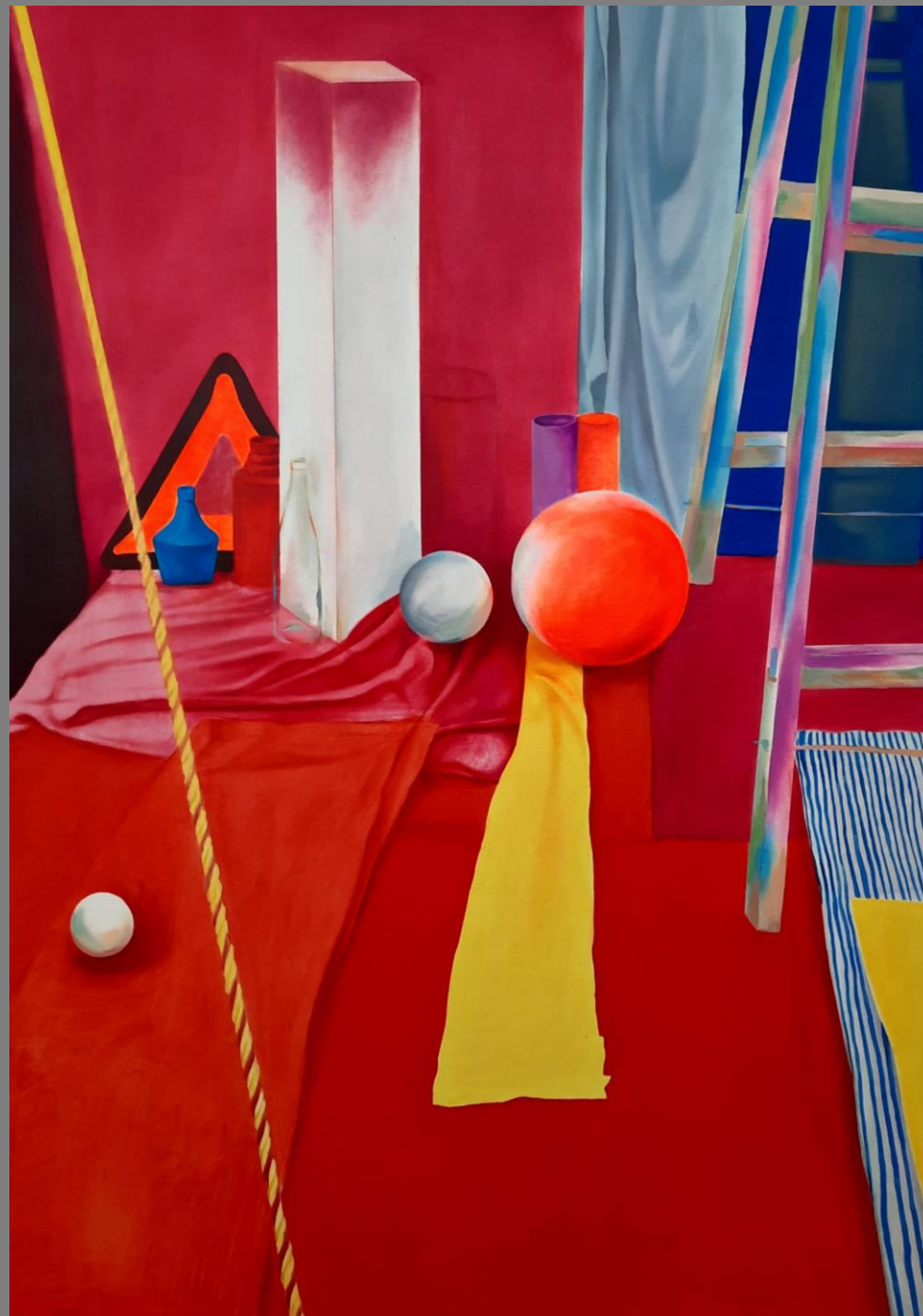
Studium martwej natury Olej na płótnie, 140x100cm