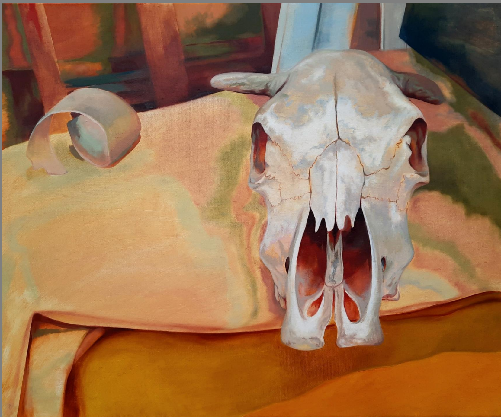
Studium martwej natury, olej na płótnie, 80x100cm