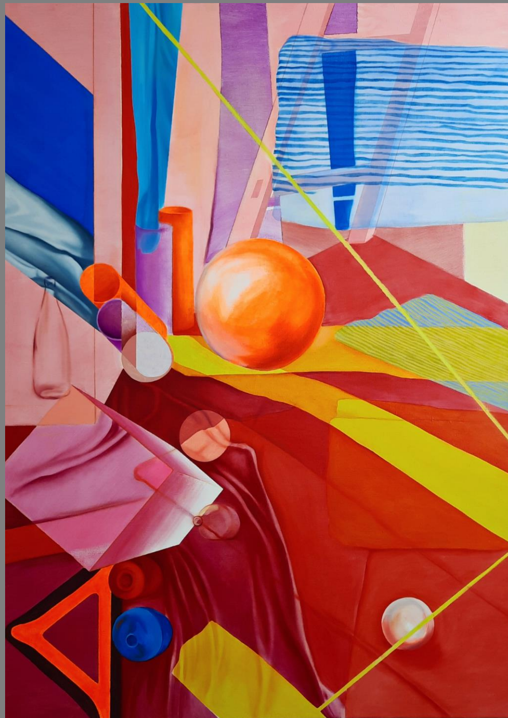
Interpretacja martwej natury Olej na płótnie, 140x100cm