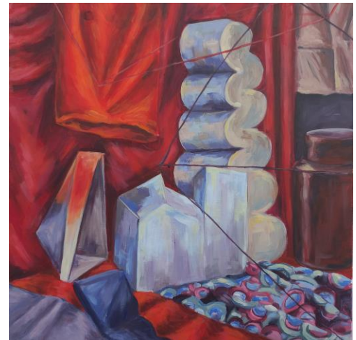
martwa natura,akryl na płótnie,40x40cm