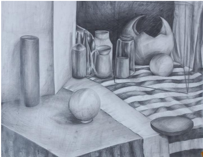
Martwa natura, ołówek