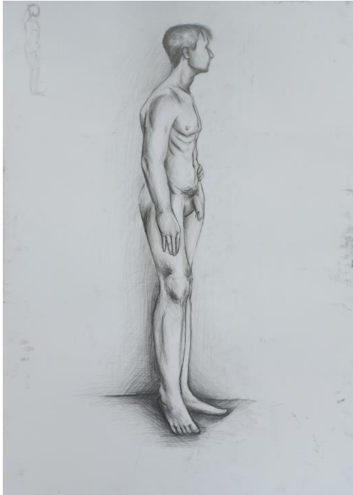
Postać, ołówek, 100x70cm