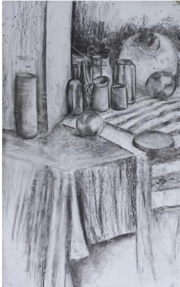
martwa natura, węgiel